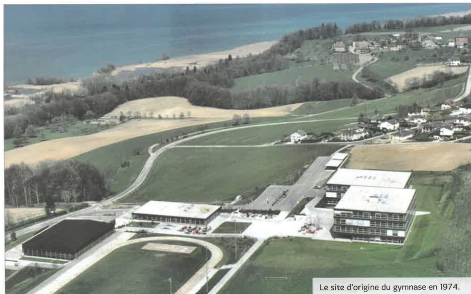
Le site d'origine du gymnase en 1974.