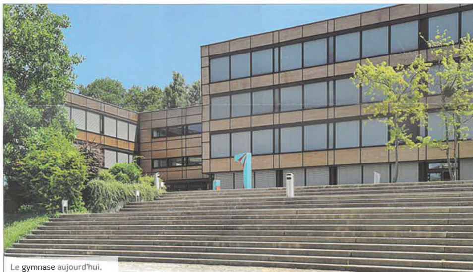
Le gymnase aujourd'hui.